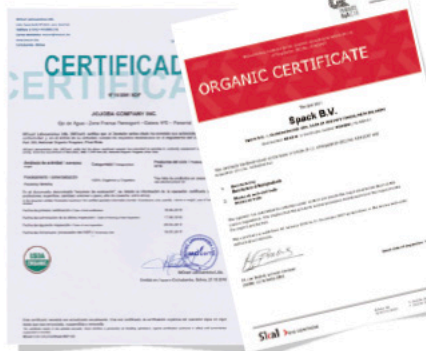
オーガニック認証書

「 Touche ma peau Problem W 」は、オーガニック認証を受けた5種類 ※1 の植物オイルを使用。自然環境に配慮した原料を使用しています。お肌にも自然にも優しい、ひとつひとつ丁寧につくられたオーガニック化粧品なのです。